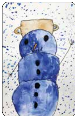
Rozárka Vránová, 3. tř.