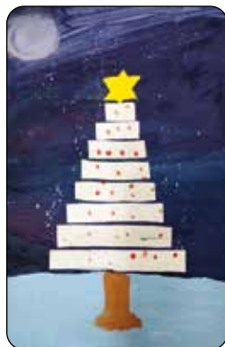
Jakub Klement, 5. tř.