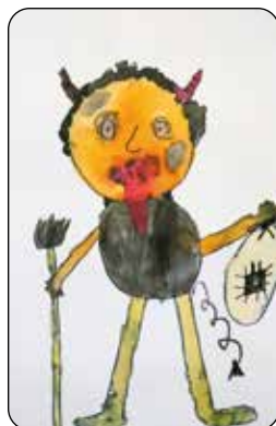
Vašík Trasoň, 3. tř.