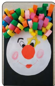
Barbora Dudláková, 3. tř