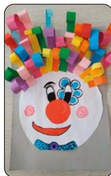
Anna Bačová, 2. tř

Přehled veřejných akcí plánovaných v obci Rusava ..... str. 27