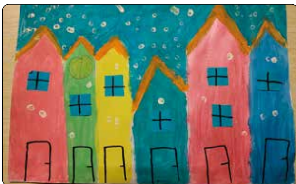
Emma Hrabalová, 4. tř.