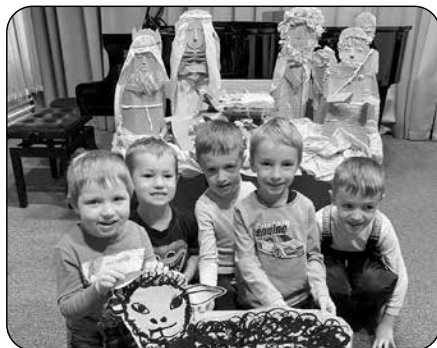
Vánoční koncert v ZUŠ B. p. H.