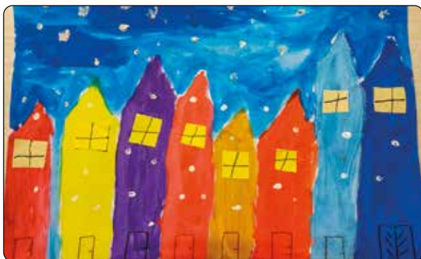
Eduard Gregor, 4. tř.