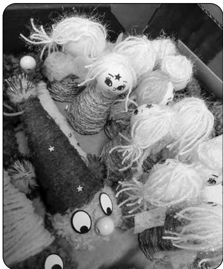
Výrobky dětí k prodeji na jarmarku