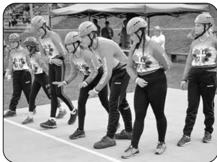
Soutěž mladých hasičů na Rusavě