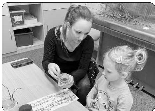
Vánoční tvoření s rodiči