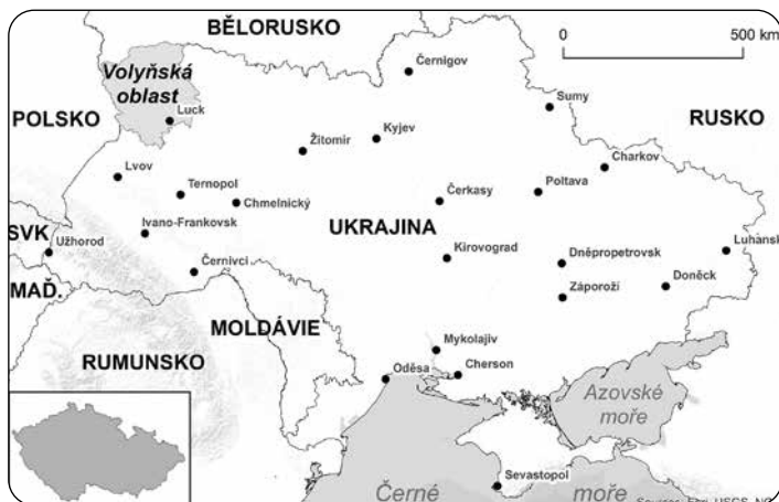
Obr. 3 – Poloha Volyňské oblasti

Na Ukrajině existuje silná česká stopa, kterou nalezneme v několika oblastech. Již v devatenáctém století se na Volyni (dnešní západní Ukrajina) začali usazovat tzv. volynští Češi. Šlo o emigranty z Rakouska-Uherska,