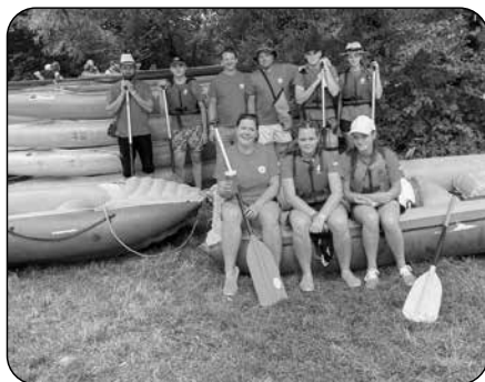
Sjezd řeky Moravy

V polovině října jsem byl osloven Svazem záchranných kynologů Moravskoslezského kraje, jestli bychom se nezúčastnili cvičení, které se koná na Rusavě. Šlo o to, že se na Rusavě pořádal praktický závod záchranných psů na hotelu Jestřábí. Za spoluúčasti policie a vedení kynologů jsme se dostavili pod majáky na Jestřábí, kde kynologům bylo vysvětleno, že se v oblasti pohřešuje dívka. Nato byli požádáni, jestli by nepomohli s pátráním. Většina se okamžitě přihlásila a začalo rozdělování. Velitel zásahu přidělil psodvům sektory pro propátrání a ostatní šli pátrat v rojnici... Pátrání bylo ukončeno bez nálezu,