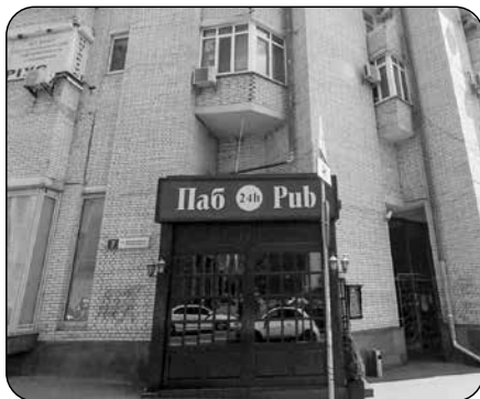
Obr. 2 – Kombinace latinky a cyrilice v označení provozovny

I když je cyrilice každodenně užívána, velmi často dochází z praktických důvodů, zejména ve větších městech, k její kombinaci s latinkou (obrázek 2).