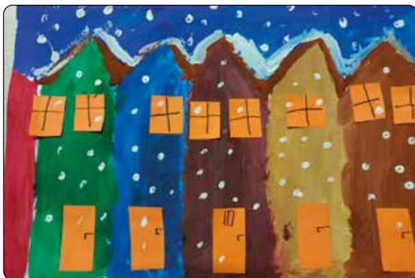
Roman Dudlák, 5. tř.