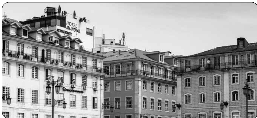
Obr. 2 – Typické fásády budov „pombalinského“ stylu...