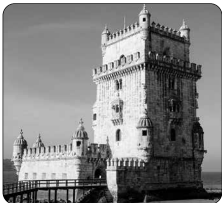
Obr. 1 – Belémská věž

se, že dosáhlo magnitudy 8,5–9,0, přičemž samotné otřesy byly následovány ničivým tsunami a rozsáhlými požáry. Katastrofa si vyžádala desítky tisíc obětí a zničila velkou část města včetně královského paláce a významných budov. Zemětřesení mělo zásadní dopad nejen na Lisabon, ale i na evropské myšlení – stalo se impulzem pro rozvoj moderní seismologie a vyvolalo filozofické debaty o smyslu katastrof například u významných filosofů jako Voltaira či Kanta.