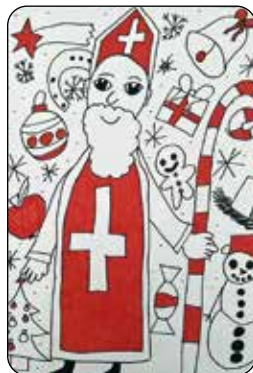
Eliška Vaclachová, 4. třída