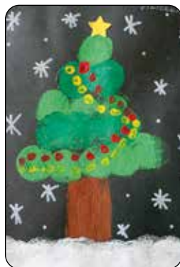
Viktorie Machová, 2. třída